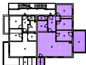
TLOCRT I. KATA